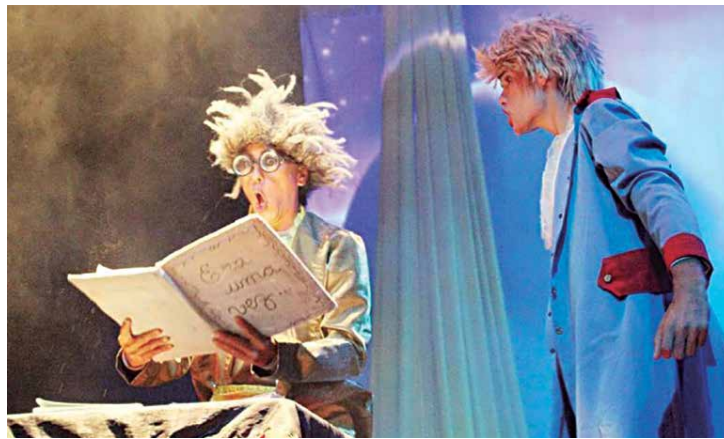
A peça é baseada no livro homônimo do escritor francês Antoine de Saint-Exupéry, os diálogos e as cenas são entregues ao abrigo Vila Vicentina