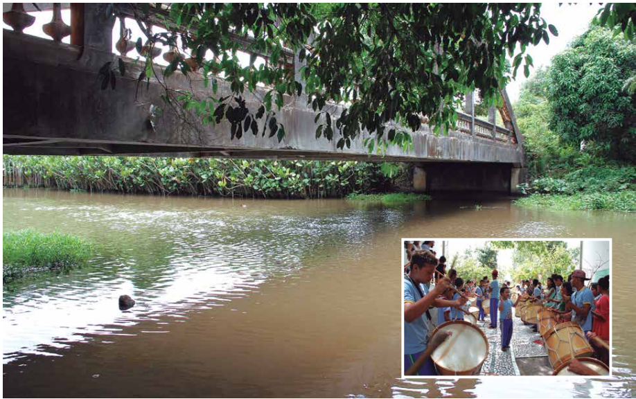
Grupo de percussão da Escola Viva Olho do Tempo vai participar do evento em prol do Rio Gramame, que abastece 70% da capital e vem sendo poluído por esgotos e pelo uso de agrotóxicos

Por ser o Mês das Águas, já que o dia 22 de março é celebrado o Dia Mundial da Água, a escola promove vários encontros e realiza caminhadas e trilhas para que as pessoas