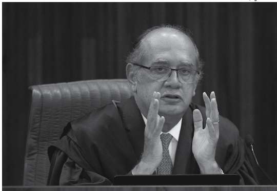
O ministro Gilmar Mendes considera lamentável o vazamento das delações de executivos da Odebrecht

Na última quarta-feira (22), o ministro do TSE, Herman Benjamin, encaminhou aos demais ministros da Corte o relatório parcial sobre a ação, relatada por ele, que pede a cassação da chapa Dilma-Temer por abuso de poder político e econômico. O objetivo foi permitir que os