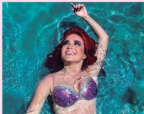
Graciosa montagem 'A Pequena Sereia', baseada na obra do escritor Christian Andersen, que abre o evento

navio. Ao ver aquilo tudo sua curiosidade fica ainda mais aguçada e Ariel só pensa em uma coisa, conhecer os Humanos. Já a atração de amanhã, o musical Enrolados, adaptado do conto da Disney, conta a história de Flynn Rydes e Rapunzel. Ele é o bandido mais procurado e sedutor do reino; ela uma jovem prestes a completar 18 anos e que tem um enorme cabelo dourado. O casal se conhece quando Flynn Rydes se esconde numa torre e lá encontra Rapunzel, que deseja deixar seu confinamento na torre para ver as luzes que sempre surgem no dia do seu aniversário. Para tanto, faz um acordo com Flynn: ele a ajuda a fugir e ela devolve a valiosa tiara que ele havia roubado.