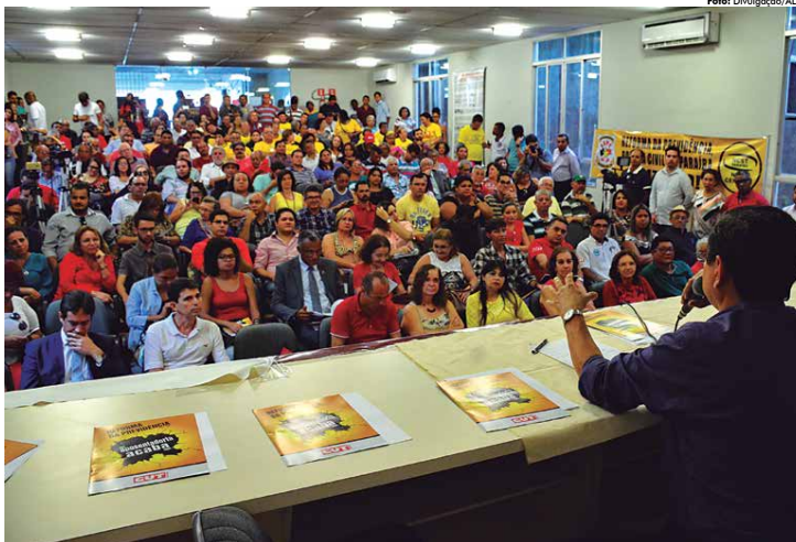
Para Anísio Maia, a reforma irá punir toda a sociedade, inclusive grupos minoritários. As mulheres, por exemplo, poderão esperar mais dez anos para se aposentar.

Na ocasião, a senadora Fátima Bezerra ressaltou que as mobilizações, como a realização de debates, já começam a dar resultado. "A população começa a ficar a par do que, de fato, está acontecendo. Os que estão contra o povo já começam a recuar. Um exemplo disso foi a aprovação da terceirização, aprovada com uma margem bem menor. Eu não tenho dúvida da importância de um debate como esse", finalizou.