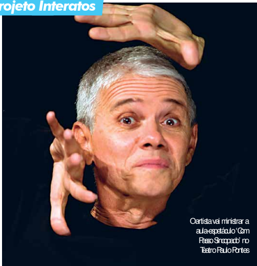
Artista vai ministrar a aula espetáculo 'Com Passo Sincopado' no Teatro Paulo Pontes